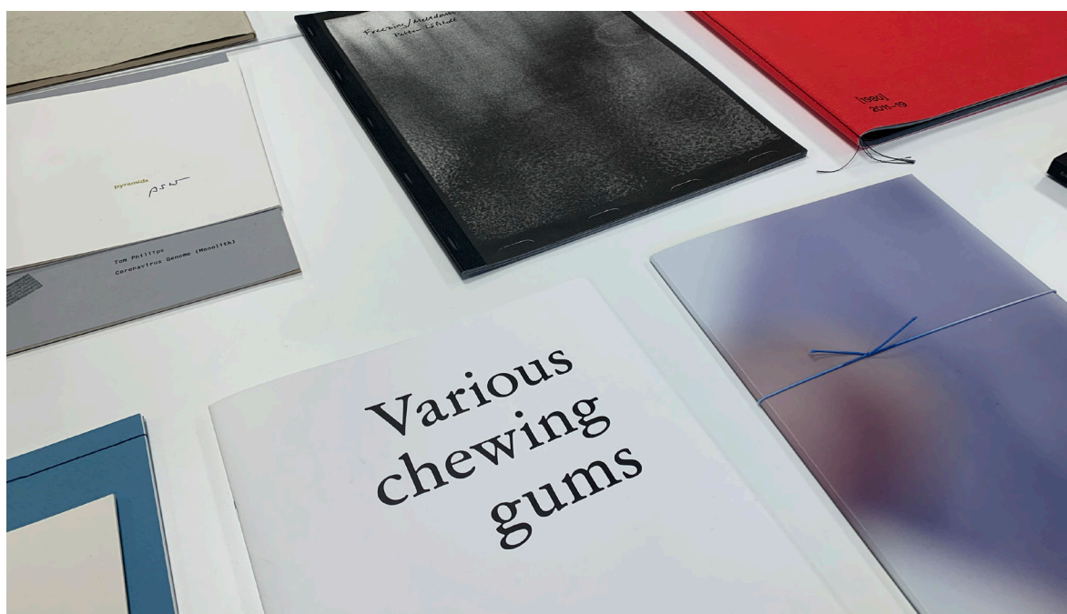
Artists' books på Göteborgs universitetsbibliotek