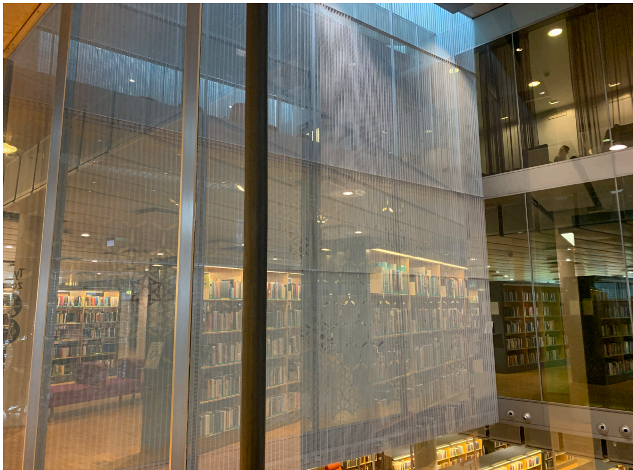
Södertörns högskolebibliotek