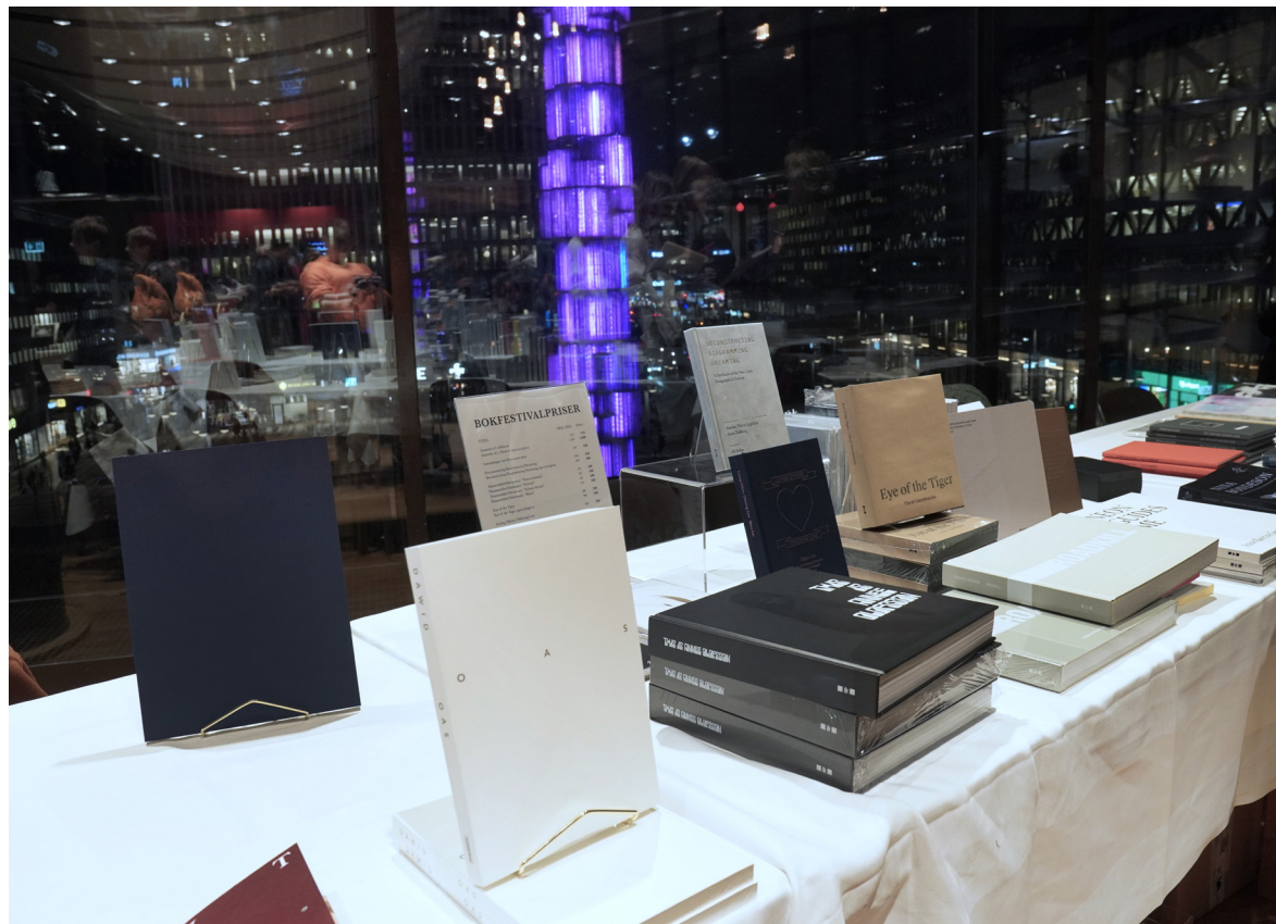
Fotoboksfestivalen på Kulturhuset Stadsteatern

Fotoboken har en egen estetisk uttrycksskärpa vad gäller innehåll, material och typografi. I flera fall intar fotoboken en politisk ståndpunkt som försvarar utbildning, ansvar, ekologi, mångfald och social rättvisa. Vi tror att en bok kan förändra livets gång och vara en mellanhand för konst, idéer och historia.