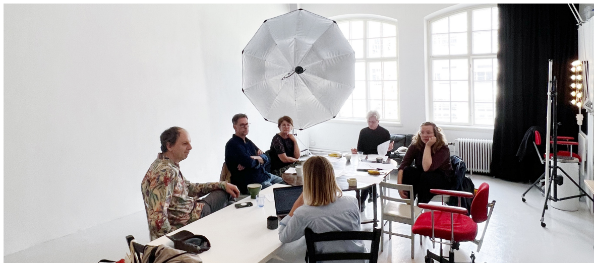
Styrelsemöte Fotoförfattarna

Vid Fotoförfattarnas årsmöte som hålls varje år innan maj månads utgång väljs styrelse och valberedning. I styrelsen sitter sju yrkesverksamma inom fotografi och bok. Under budgetåret har styrelsen 6-8 protokollförda styrelsemöten. Däremellan förekommer det informella träffar samt kontakt via telefon och e-post. Både ordinarie ledamöter och suppleanter deltar på styrelsemötena. Ordförandearvode, arvoden till ledamöter och suppleanter för möten och kommittéarbete utgår.