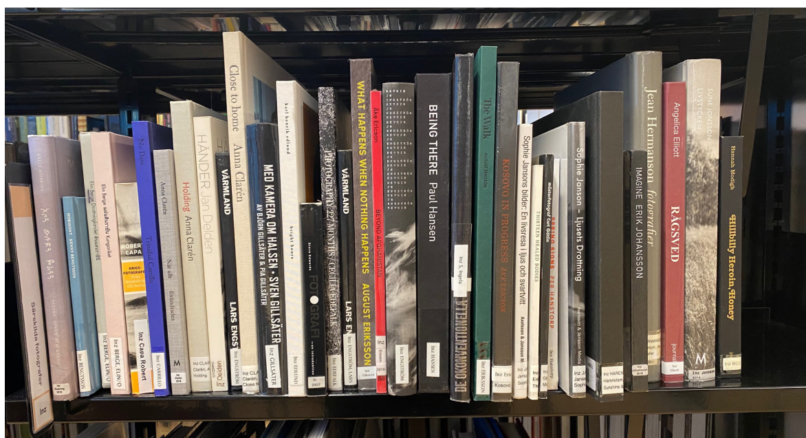
Örebro stadsbibliotek

I samarbete med Centrum för Fotografi organiserar vi samtal, föreläsningar och utställningar av fotoböcker på bibliotek runt om i Sverige. Vi arbetar med att stödja biblioteken i hela Sverige så att de på ett enkelt sätt ska kunna aktivera, diskutera och uppmärksamma fotoboken. Under året har vi för avsikt att starta en referensgrupp med representanter från bibliotek, våra respektive organisationer samt med upphovspersoner där vi diskuterar och fokuserar på frågor relaterade till fotoböcker på bibliotek. Genom medlemmar och låntagare kartlägger Fotoförfattarna också fotoboksbeståndet på biblioteken runt om i Sverige. Vi planerar att utse Sveriges bästa fotoboksbibliotek under hösten 2023.