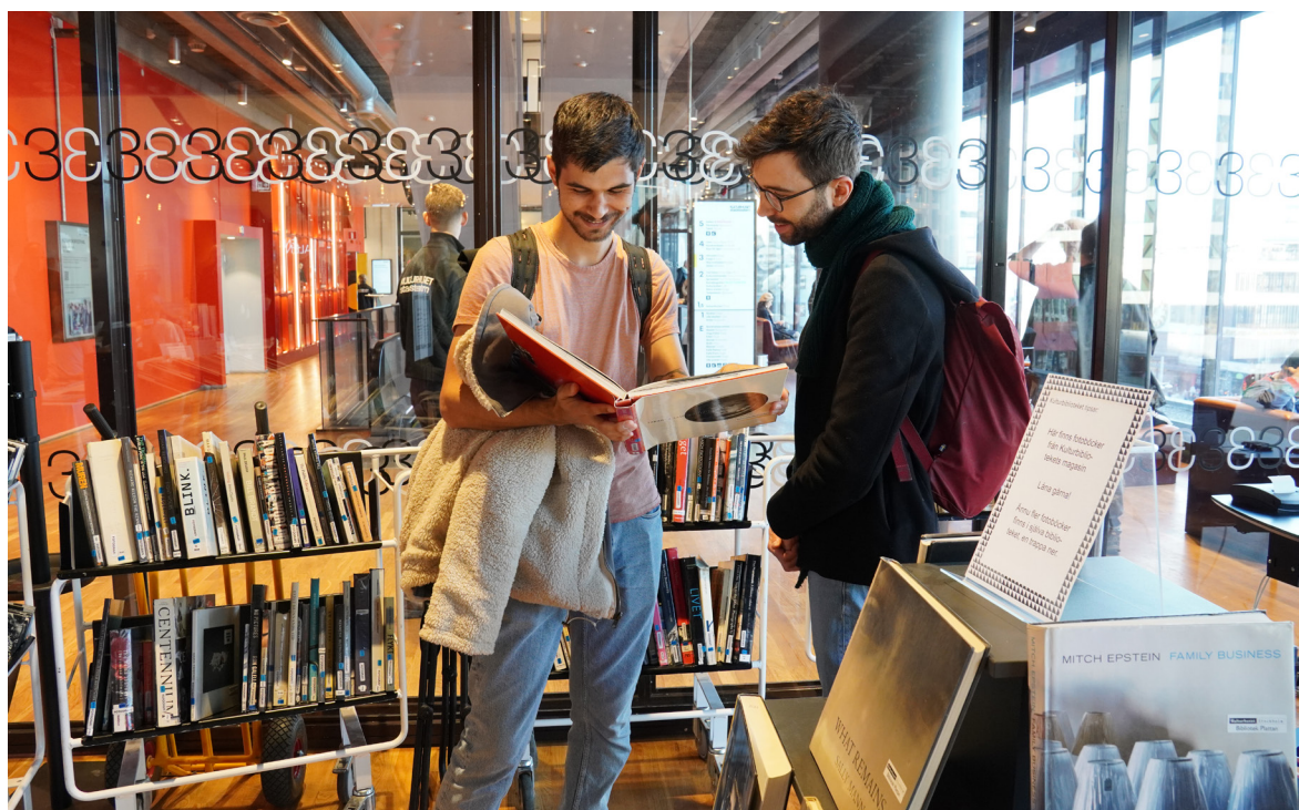
Kulturbiblioteket på Kulturhuset Stadsteatern, foto: Felicia Gränd

Fotoförfattarna har för avsikt att instifta ett stipendium för studenter på utbildningarna för bibliotekarier till den som skriver sin masteruppsats om fotoboken för att inspirera till att öka kunskapen om fotoboken på utbildningarna för bibliotekarier.