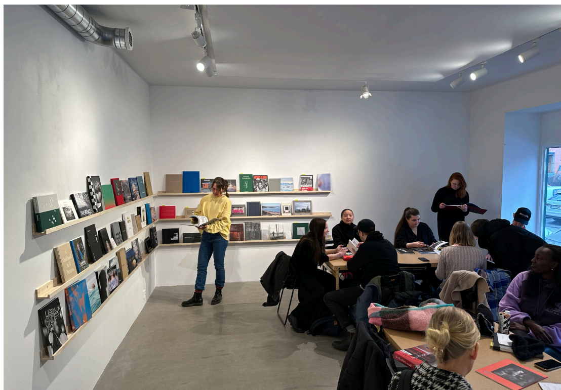
Fotobokutställningen på Centrum för fotografi

Vi fortsätter att arrangera fotobokscirklar och feedback i samarbete med Centrum för fotografi (CFF) och andra aktörer. Under handledning av erfarna fotoförfattare och pedagoger fokuserar man på läsningen av bilder men även texter i fotoboken. Vi bjuder in både medlemmar och ickemedlemmar att delta. Under 2023 planerar vi också i större utsträckning än tidigare att arrangera samtal, workshops och cirklar på de bibliotek och platser där fotoboksprisets fotoboksutställningar befinner sig.