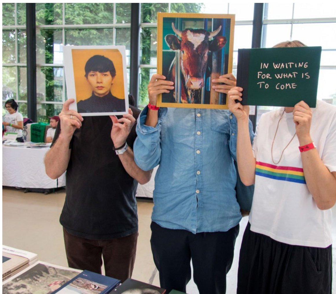
Fotobokfestival Kassel, foto av Hendrik Zeitler.