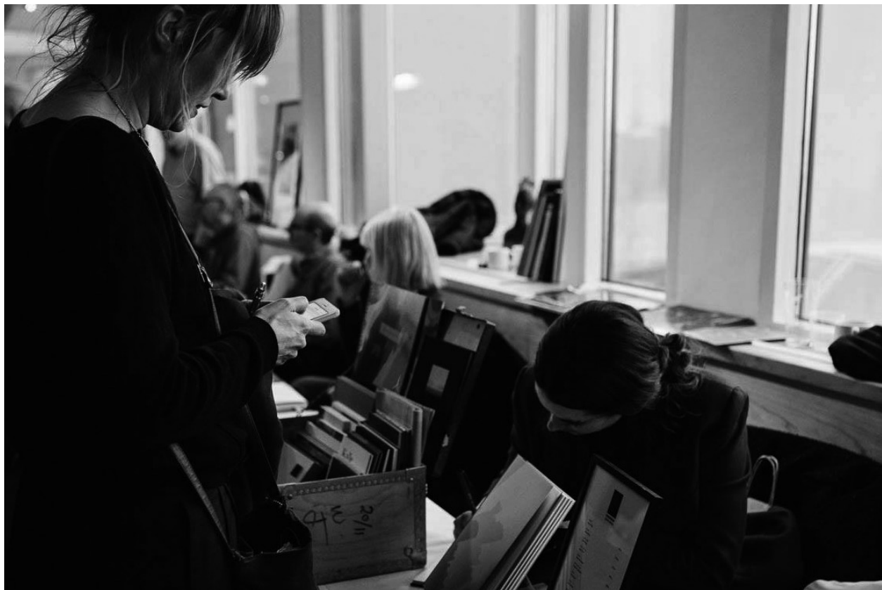
Fotoboksdagen på Hilton, foto av Sofia Nahringbauer.