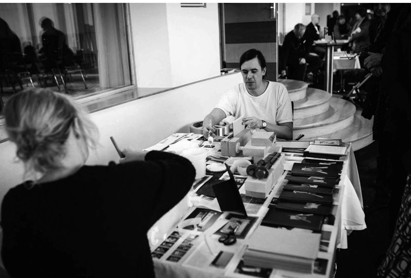
Fotoboksdagen på Hilton, Stockholm, foto av Sofia Nahringsbauer.