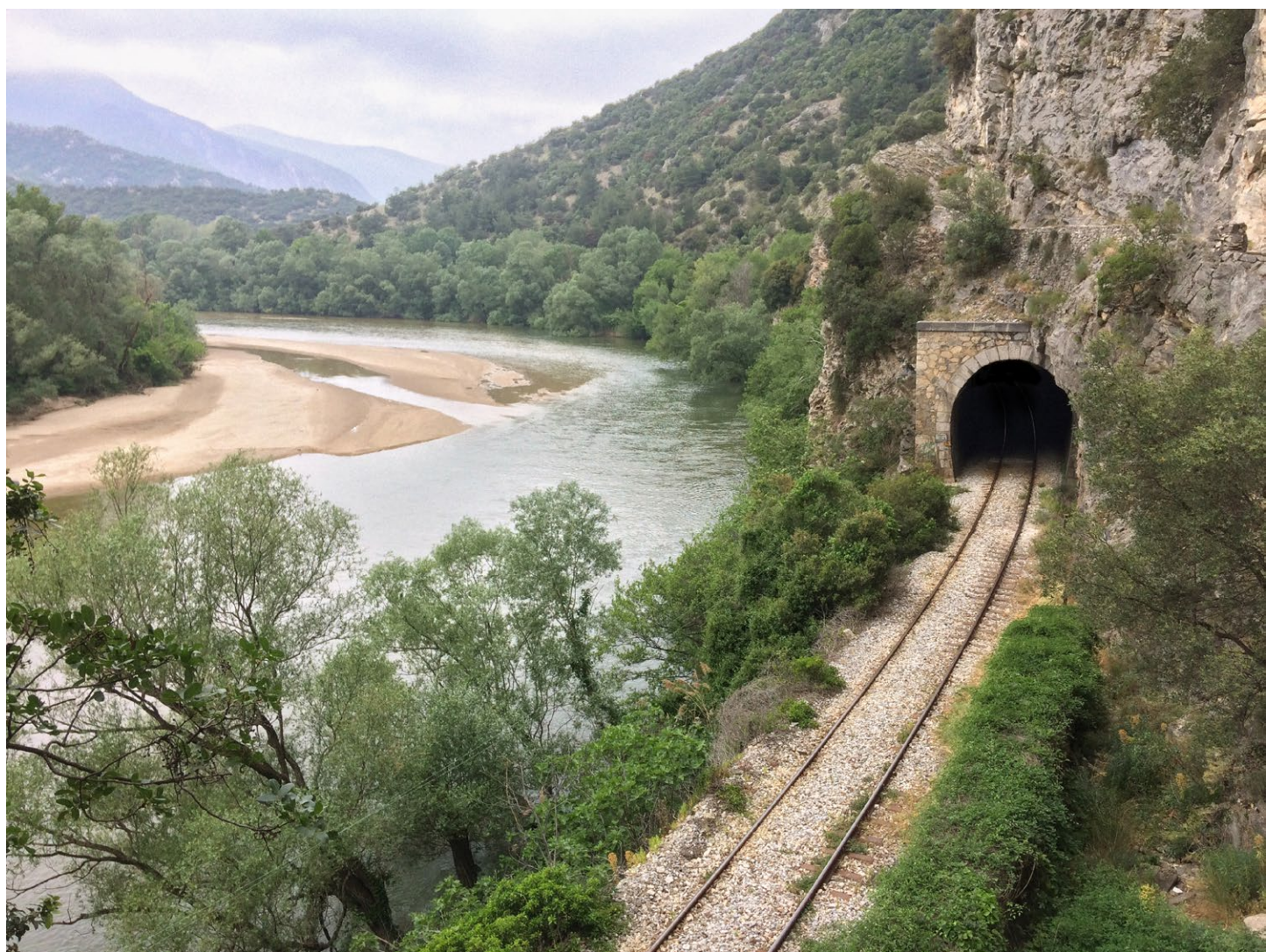
Björn Engberg, Kavallastipendiat 2018, foto av Björn Engberg.