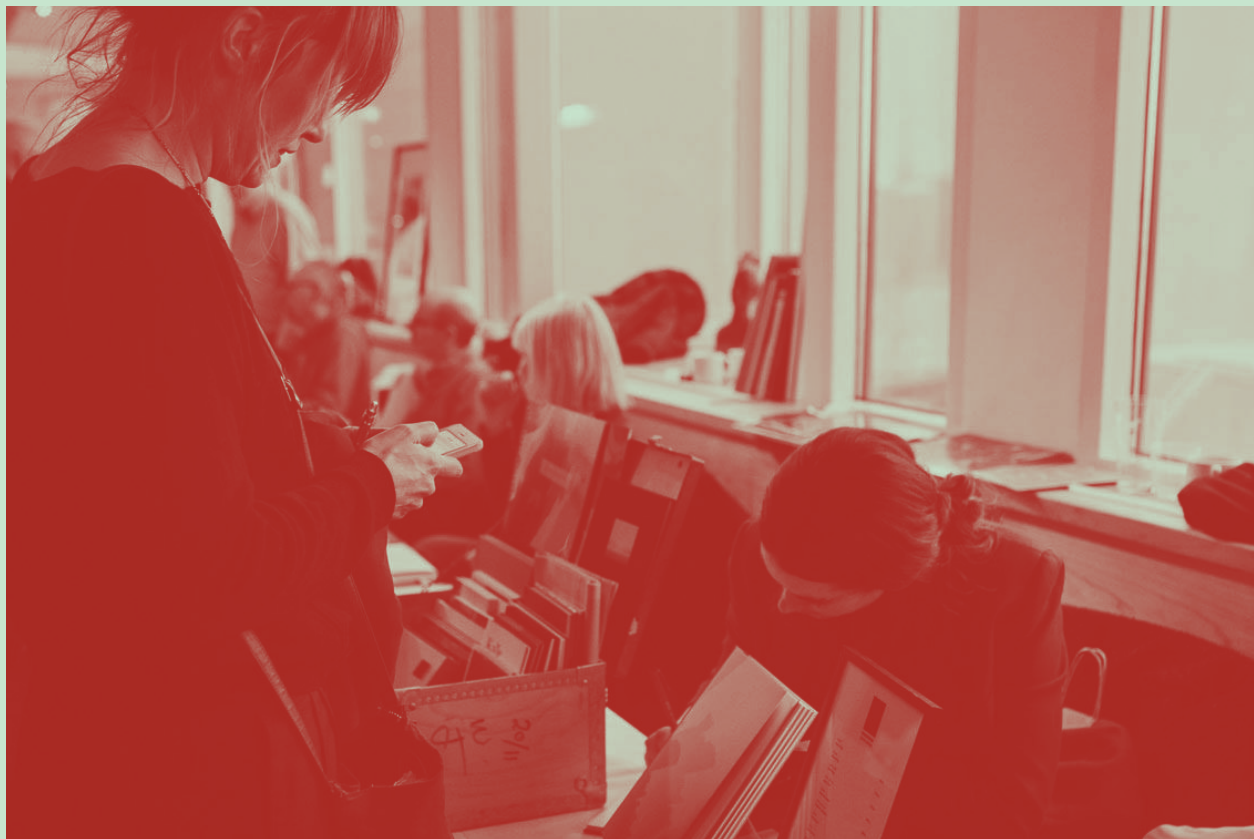
Fotoboksdagen på Hilton.