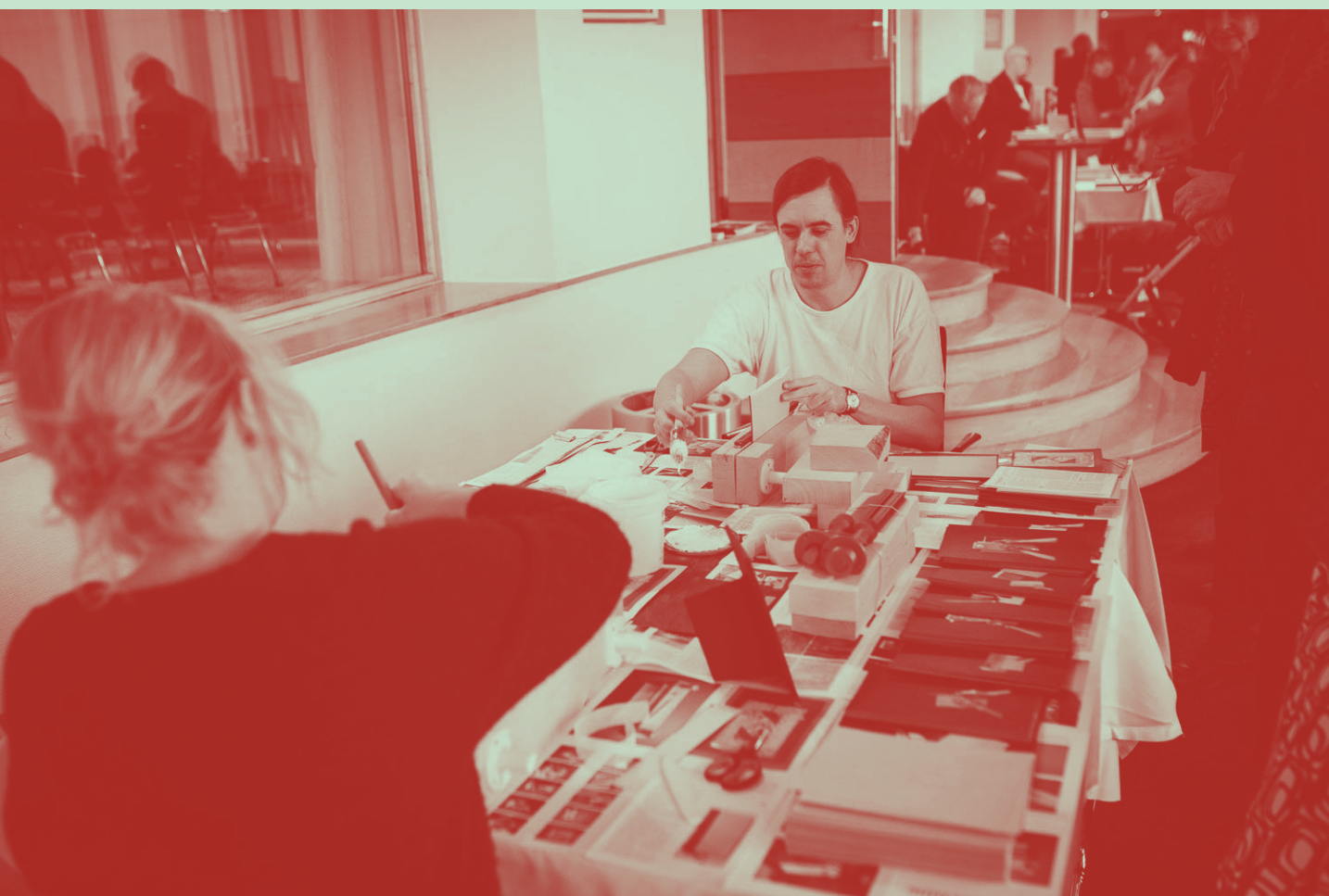
Fotoboksdagen på Hilton, Stockholm, foto av Sofia Nahringsbauer.