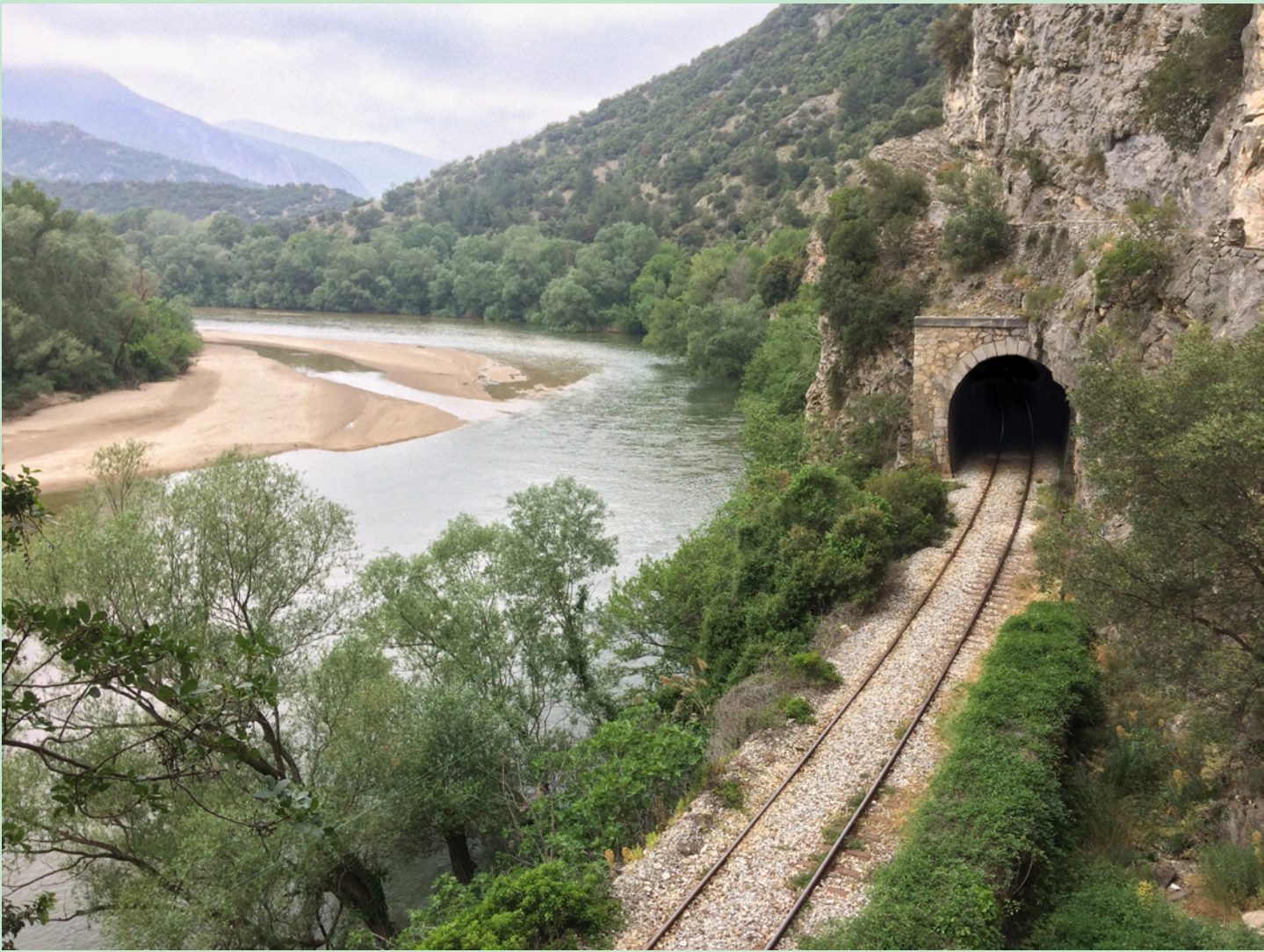
Björn Engberg, Kavallastipendiat 2018, foto av Björn Engberg.