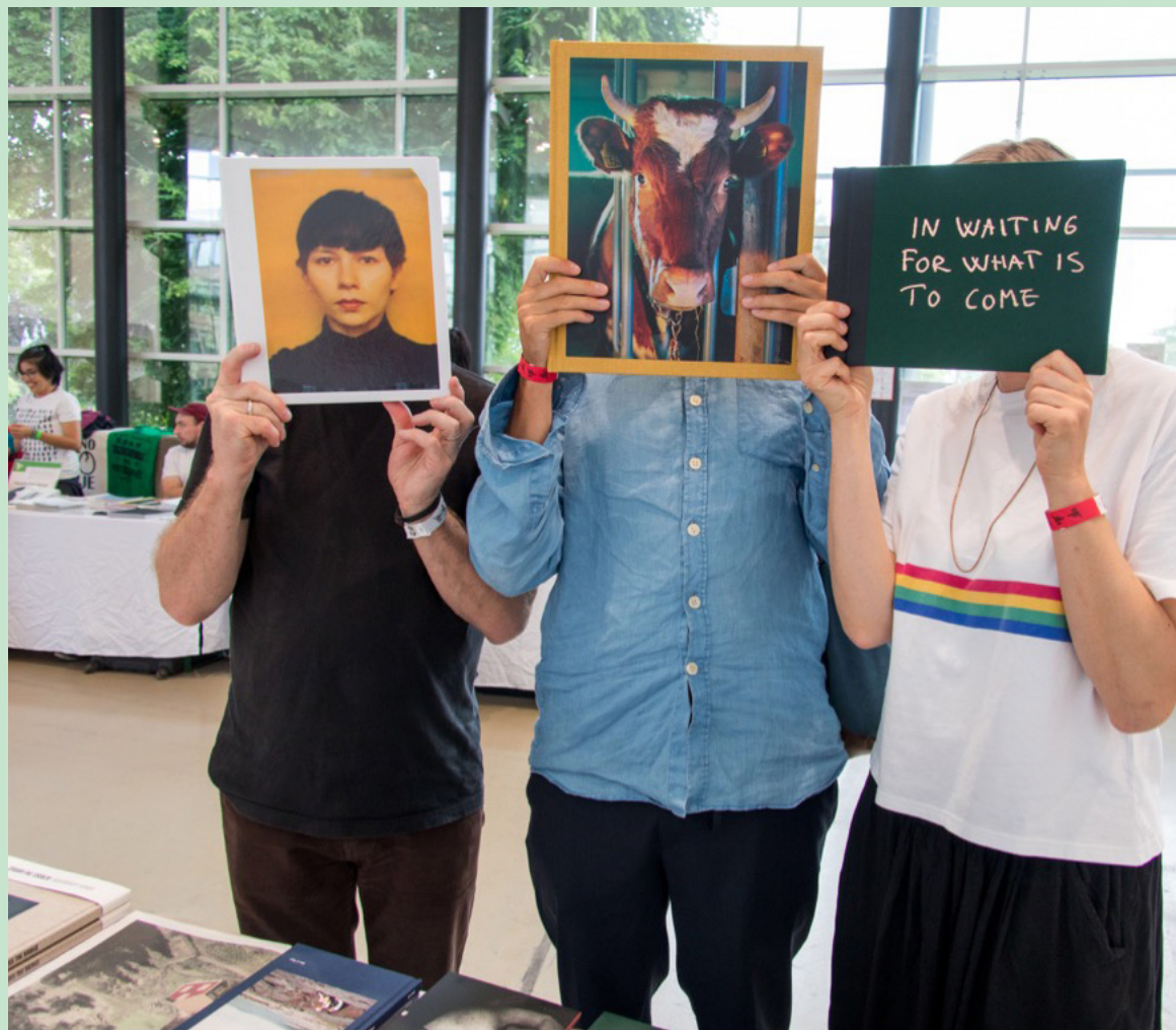
Fotobokfestival Kassel, foto av Hendrik Zeitler.