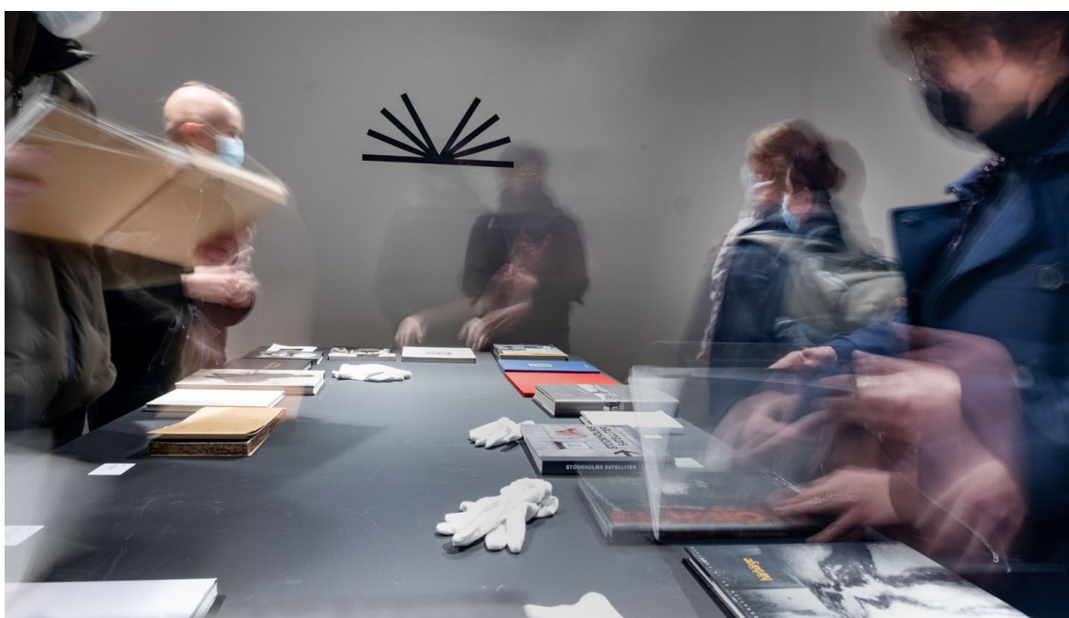
Fotobokspriset 25 år på Svenska institutet i Paris

Vårt arbete fokuserar på hur fotografer och fotoförfattare ska kunna vara yrkesverksamma och hur infrastrukturen för professionellt skapande och förmedling av kulturella upprätthållas. Genom att medverka på digitala plattformar, både nationellt och internationellt anpassar vi vår verksamhet på bästa sätt efter delvis nya förutsättningar och plattformar att verka på. En viktig målsättning för Fotoförfattarna är att fortsatt utöka samarbetet med biblioteken och erbjuda möten, releaser och information om fotoboken och fotobokspriset för att stärka fotoboken och de litterära upphovspersonernas ställning. Vi arbetar också för en förnyad bibliotekspolitik där bibliotekens demokratiska uppdrag står i fokus inför framtiden.