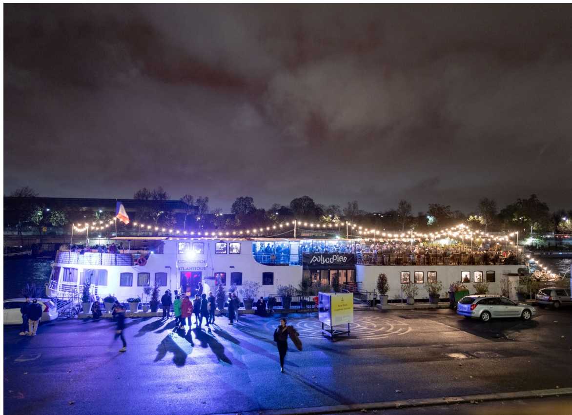
Polycopies i Paris

Fotoförfattarna inom Svenska Fotografers Förbund, bildades 1972 för att ge fotoboksproducerande fotografer större möjligheter att verka strategiskt och kollektivt för att stärka den fotografiska litteraturens ställning, samt för att förbättra villkoren för fotografer som arbetar med böcker. Verksamheten gynnar fotografer, både inom och utom förbundet, som ägnar sig åt bokutgivning och skapar innehåll till litteratur.