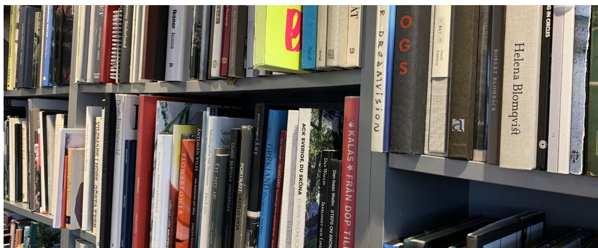
Fotoboksbiblioteket på SFF, foto: Annika Thörn Legzdins

Fotoförfattarna förvaltar för närvarande en fond för fotografers yttrandefrihet och upphovsrätt där medlemmar i SFF/Fotoförfattarna kan söka pengar. Medel ur fonden får disponeras för bidrag till medlem av SFF/Fotoförfattarna som lidit ekonomisk skada om saken är av betydelse för att stödja yttrandefriheten eller upphovsrätten. Medlemmen ska ha varit medlem i SFF senast det datum då tvisten utbröt.