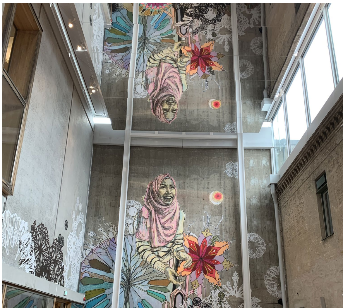
Skissermas Museum i Lund

På webbplatsen för hela SFF, sfoto.se , har Fotoförfattarna en egen portal med rubriken Fotoförfattarna. Där presenterar vi vår verksamhet, styrelsen, nyutgivna fotoböcker, stipendierna, Fotoförfattarna Möter, Fotobokspodden och Svenska Fotobokspriset. Där finns även en fotoboksguide med info om fotoboksförlag och tips om finansiering och planering av en bokproduktion. På Facebook har Fotoförfattarna en egen sida och på Instagram publiceras vårt material på Svenska Fotografers Förbunds konto. Tillsammans med kansliet fortsätter vi att arbeta aktivt för att synliggöra vår verksamhet och förmedla information för upphovspersonernas bästa.