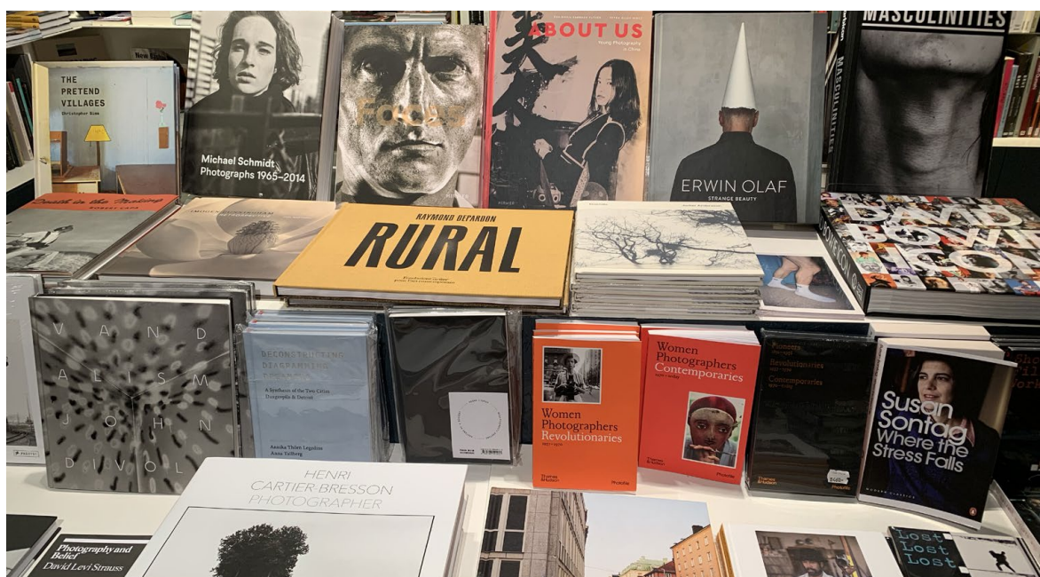
Moderna Museets bokshop, foto: Annika Thörn Legzdins

Biblioteksförhandlingarna med staten om bibliotekersättningen äger rum nästa gång under våren 2023.