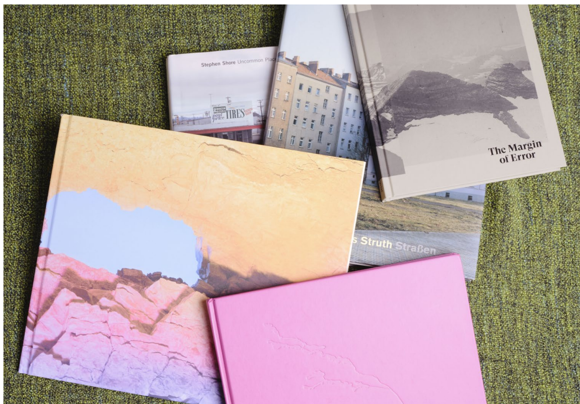
Fotobokscirkel landskap

Vi fortsätter att arrangera fotobokscirklar och feedback i samarbete med CFF. Under handledning av erfarna fotoförfattare och pedagoger fokuserar man på läsningen av bilder men även texter i fotoboken. Vi bjuder in både medlemmar och ickemedlemmar att delta. Under 2022 planerar vi också i större utsträckning än tidigare att arrangera workshops och cirklar på de bibliotek och platser där fotoboksutställningarna befinner sig.